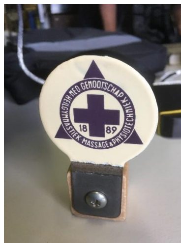
De nieuwste aanwinst van de SGF te Urk, een herkenningbord wat op de fiets werd gemonteerd in de jaren 50. 4

wetenschap onderbouwde professie die herkenbaar is voor patiënten.