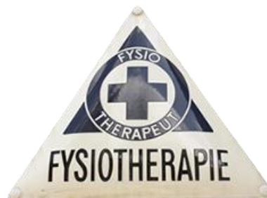
Medisch herkenningsschild Fysiotherapie

aan bij deze gebruikelijke trend in de gezondheidszorg. Fysiotherapeuten kennen geen 'Eed van Hippocrates' zoals bij de artsen, verpleegkundigen en verzorgenden echter is er wel een belofte van geheimhouding.