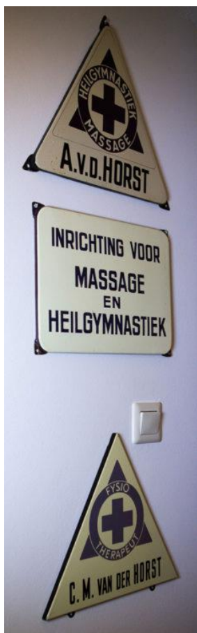
Collectie herkenningsschilden SGF, Urk. 4