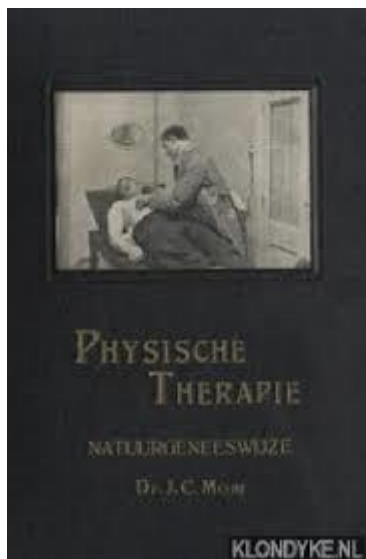
Boek Physische Therapie Dr. Mom