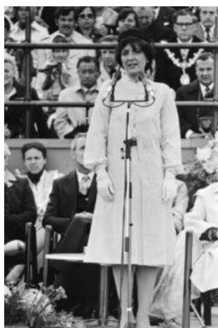
Olympic Village met Prinses Margriet tijdens de opening.

Het nieuws werd dagelijks gebracht door een speciaal uitgebrachte internationale krant 'de Olympic Village' met op de voorpagina het bezoek van Koningin Beatrix.