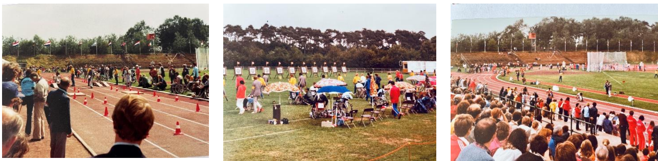
Paralympics in Nederland (1980)

De Paralympische Spelen vinden vanaf 1988 in dezelfde stad plaats waar de Olympische Spelen worden gehouden; al is dit pas in 2001 officieel ingevoerd. De kans dat we de Paralympics nog eens in Nederland mogen organiseren is dus alleen nog mogelijk als we ook de Olympische Spelen hier halen. Des te meer om deze herinneringen te koesteren.