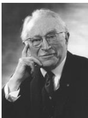
Sir Ludwig Guttmann

Het was een idee van Sir Ludwig Guttmann, om met regelmaat wedstrijden te organiseren voor mensen met een beperking. Guttmann organiseerde in het ziekenhuis, in Stoke Mandeville, wedstrijden voor patiënten met een