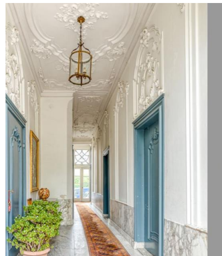
Links en rechts het huidige pand anno 2022 en voormalig Zanderinstituut te Utrecht waar ook kamerconcerten worden gegeven.