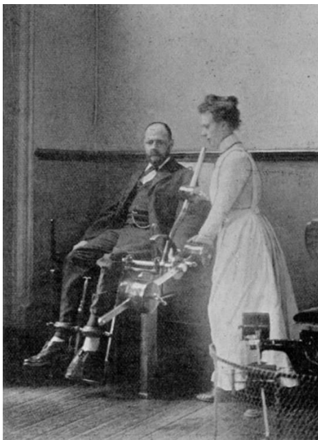
Heilgymnastiek anno 1900

Graag nemen we u eens mee hoe 100 jaar geleden, in dit geval in Utrecht, een consultatie- bureau voor mensen met 'lichamelijke beperkingen, deformiteiten, houdingsafwijkingen' etc. in zijn werk ging. Hoe werd er geschreven (of gedacht) over dergelijke aandoeningen en hoe organiseerde men dat? Wat waren de drijfveren en de sociaaleconomische overwegingen? Zijn er nog ervaringsverhalen?