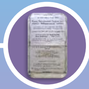
29,30,31 augustus 1912

Boek: Heilgymnastiek, Massage en Orthopedische bandages (Mechanotherapie) "Heilgymnast-masseur is zuiver technisch assistent van de wetenschappelijk ontwikkelde arts". (1890)