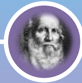
Friedrich Ludwig Jahn 1778-1852 Duitsland

Boek: Gymnastik für die Jugend, enthaltend eine Pracktische Anweisung zu Leibesübungen (1793)