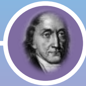
Johann Christoph Friedrich GutsMuths 1759 -1839 Duitsland

Passieve oefeningen zijn massagetechnieken