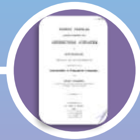
Eduard Bullerdieck ? -1867

Medische gymnastiek als belangrijk geneesmiddel werd ook bereikbaar voor minder goeuden