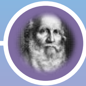
Friedrich Ludwig Jahn 1778-1852 Duitsland

Boek: Gymnastik für die Jugend, enthaltend eine Pracktische Anweisung zu Leibesübungen (1793)