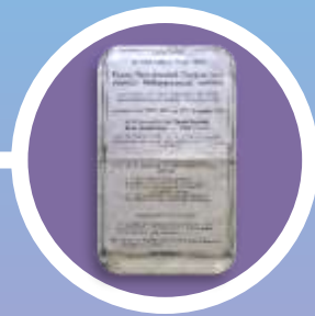
29,30,31 augustus 1912

Boek: Heilgymnastiek, Massage en Orthopedische bandages (Mechanotherapie) "Heilgymnast-masseur is zuiver technisch assistent van de wetenschappelijk ontwikkelde arts". (1890)