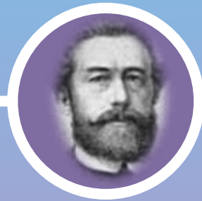
Daniel Gottlieb Moritz Schreber 1808-1861 Duitsland

Opende in 1828 Orthopedische instelling voor mechanische en dynamische behandelingen in Den Haag