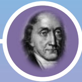
Johann Christoph Friedrich GutsMuths 1759 -1839 Duitsland

Passieve oefeningen zijn massagetechnieken