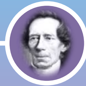
Johan Rudolf Thorbecke 1798-1872

Boek: Eerste verslag omtrent de inrigting voor geneeskundige gymnastiek te Rotterdam (1863)