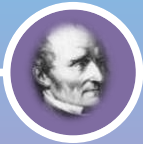
Pehr Henrik Ling 1776-1839 Zweden

Grondlegger Zweedse (medische) gymnastiek