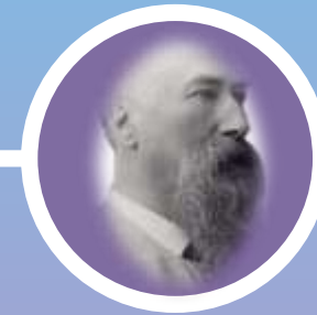
Johann Georg Mezger 1838-1909

De medici kregen praktisch een wettelijk gelegitimeerde monopolie positie op het gebied van de gezondheidszorg